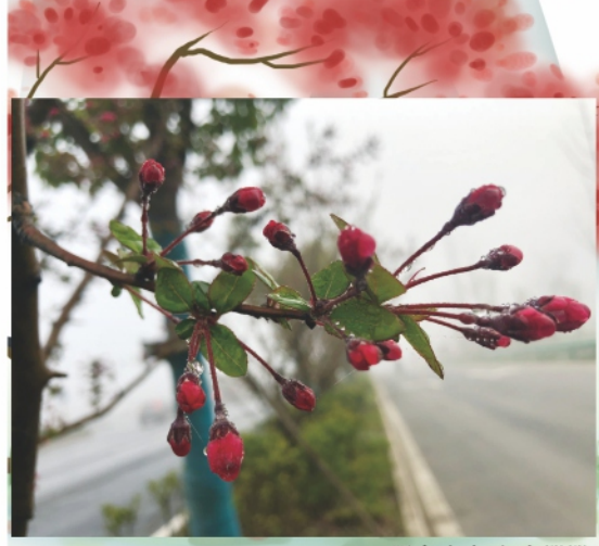
肥东分公司 宣期期